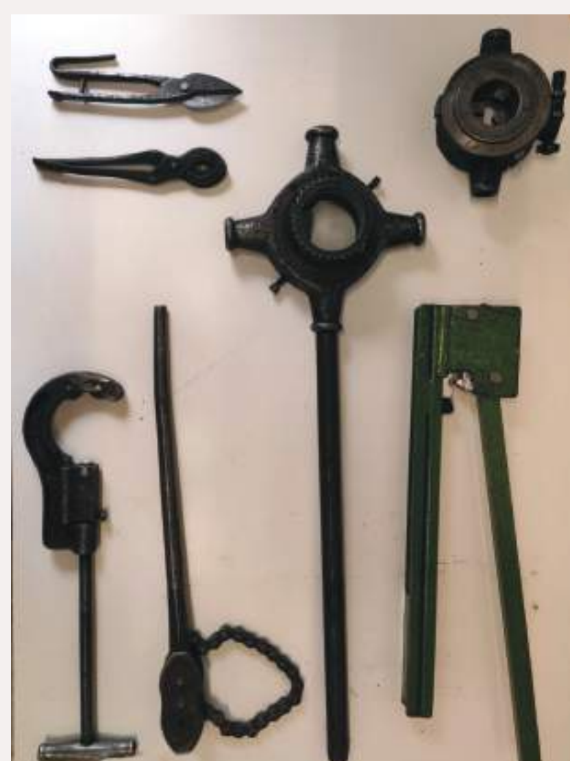
Terrajas, llave de cadena, herramienta de corte de tuberías, tijeras, tenazas.