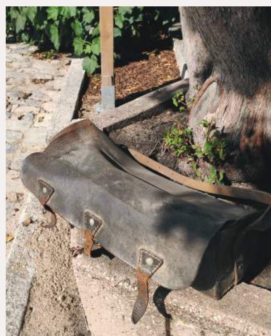
Maletín de herramientas