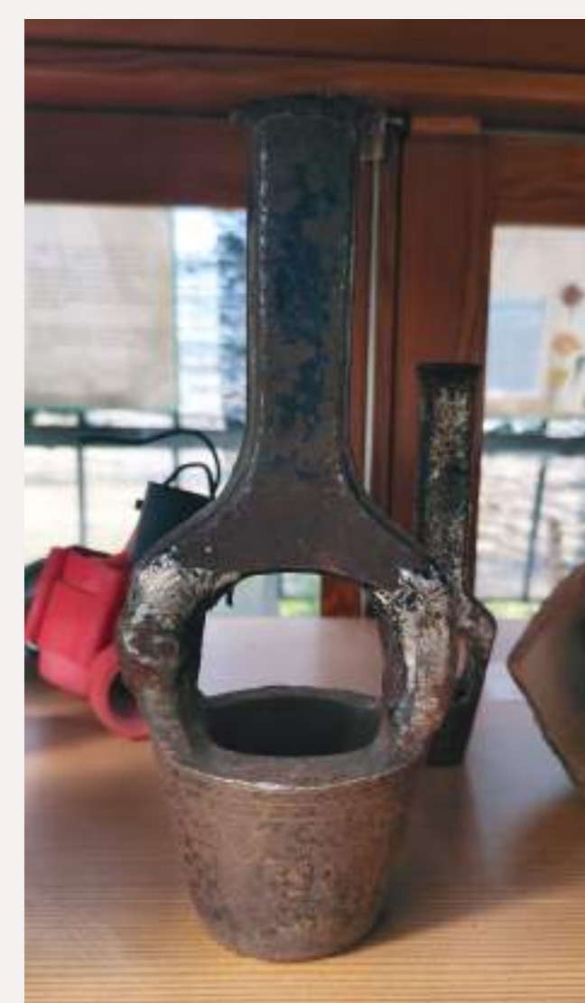
Troquel para juntas.