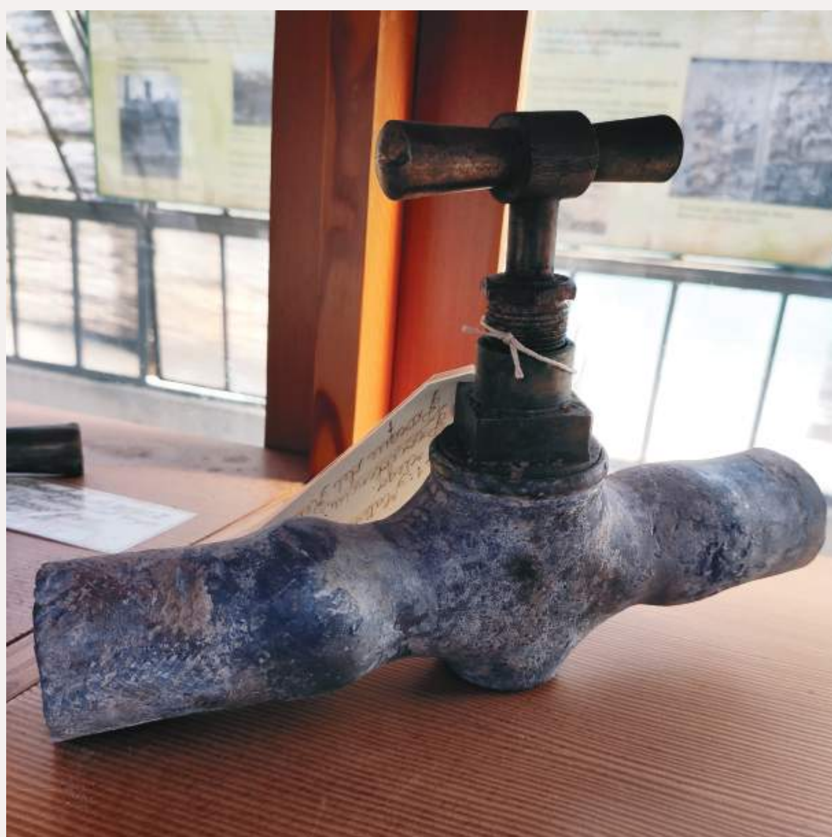
Tubería de plomo con llave de bronce.