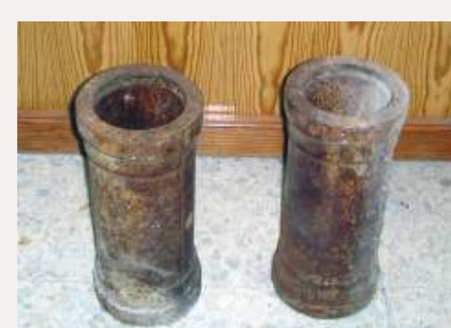
Tuberías de hierro fundido.