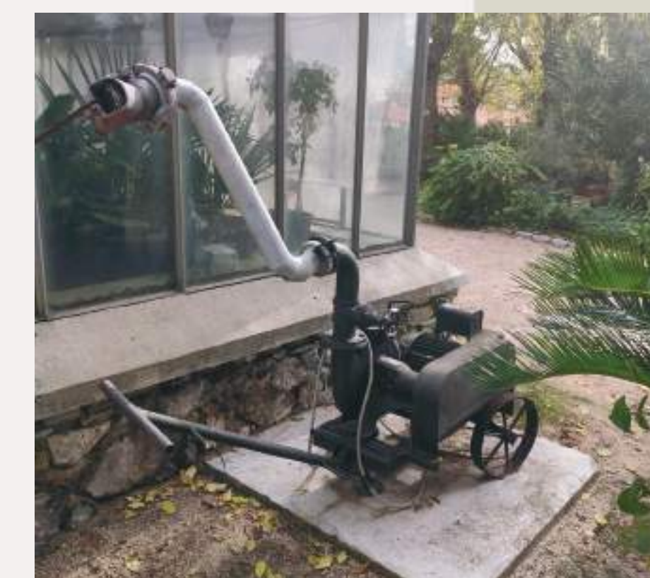
Bomba de purines del antiguo estercolero.