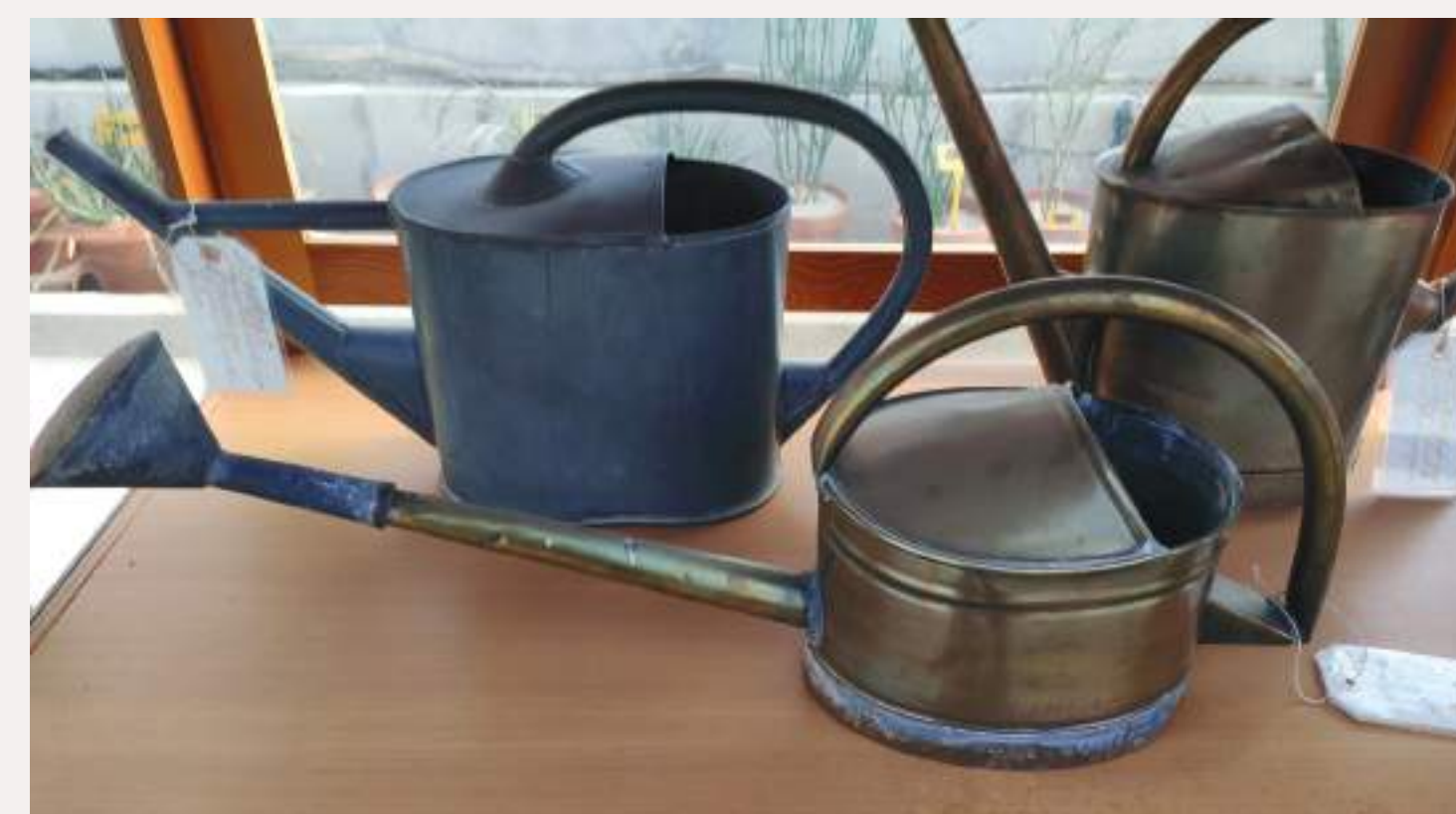
Regaderas y alcachofas con reparaciones realizadas por los fontaneros.

Elementos de riego, según el Dictionnaire Pratique d'Horticulture et de Jardinage de Nicholson y Mottet, de 1892 (BnF). De izquierda a derecha: bomba manual Rocher-Andoche montada sobre carretilla; regadera con mango curvo largo para favorecer su inclinación en el riego; bomba manual Gariel de movimiento oscilante.