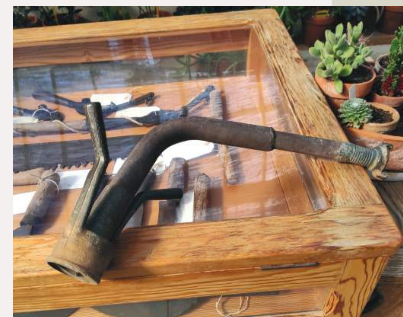
Conexión para toma de riego tipo Madrid.