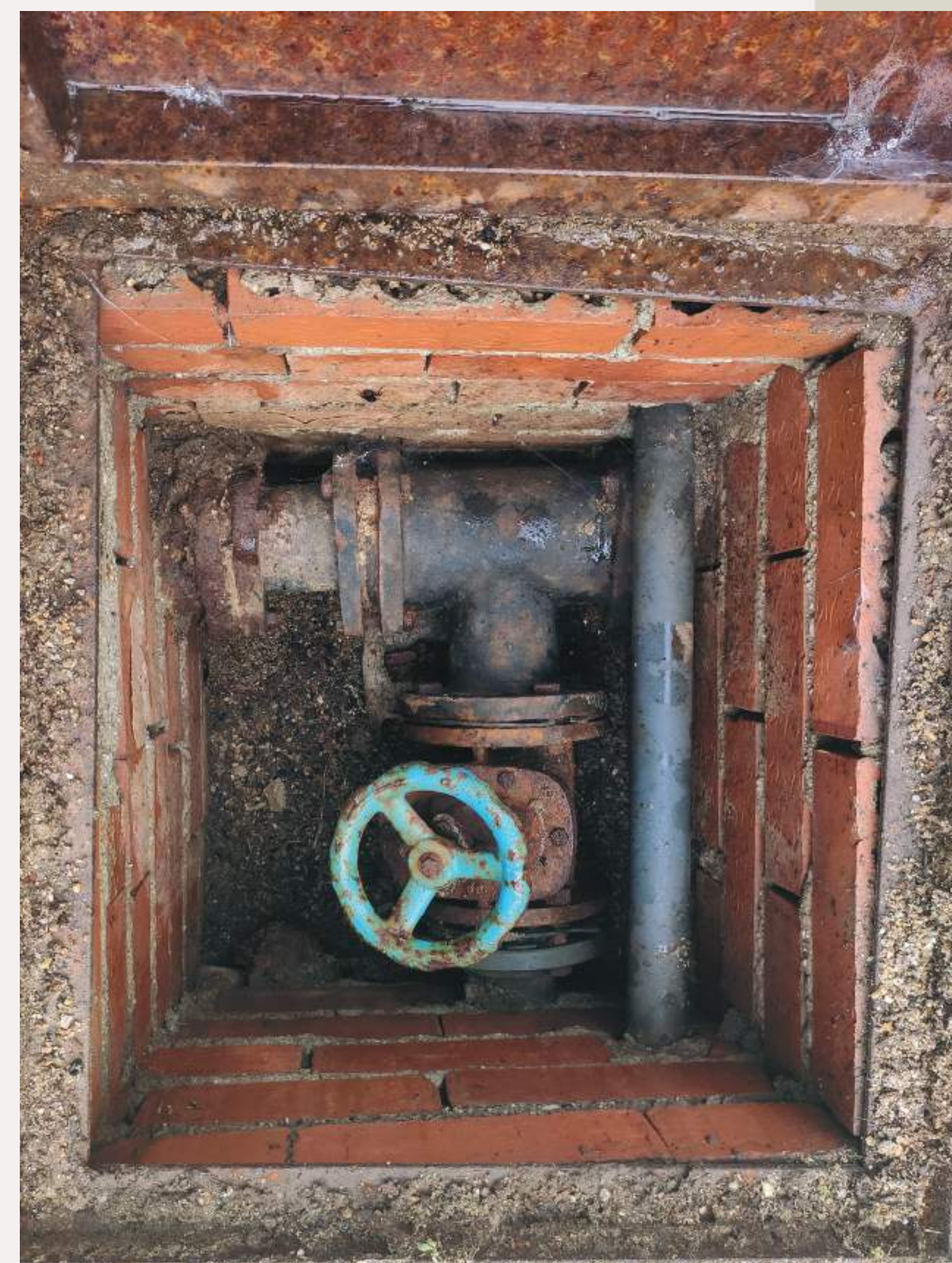
Llave principal del sistema de riego del Vivero de Estufas. El agua procedía del Estanque Grande del Retiro.